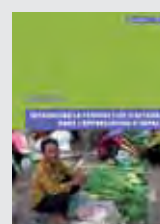
HORS SERIE N°7 INTRODUIRE LA PERSPECTIVE D'ACTEURS DANS L'ANALYSE D'IMPACT H. HADJAJ-CASTRO, A. LAMBERT