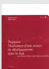
HORS SERIE N°2 ORGANISER L'EVALUATION D'UNE ACTION DE DEVELOPPEMENT DANS LE SUD C. LELOUP, S. DESCROIX