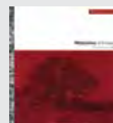
HORS SERIE N°4 HISTOIRES D'EVALUATION S. DESCROIX