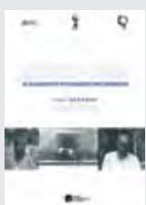
HORS SERIE N°3 NORD-SUD. SE DOCUMENTER ET ORGANISER UNE RECHERCHE P. GERADIN, C. SLUSE