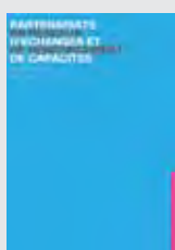
ETUDE-RECHERCHE PARTENARIATS EN RESEAUX D'ECHANGES ET DE RENFORCEMENT DE CAPACITES S. BOULC'H