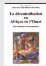
LA DECENTRALISATION EN AFRIQUE DE L'OUEST : ENTRE POLITIQUE ET DEVELOPPEMENT ED. KARTHALA