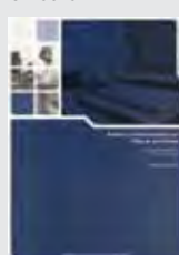
HORS SERIE N°5 RADIOS COMMUNAUTAIRES EN AFRIQUE DE L'OUEST S. BOULC'H