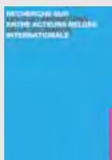
ETUDE-RECHERCHE RECHERCHE SUR LES COLLABORATIONS ENTRE ACTEURS BELGES DE LA SOLIDARITE INTERNATIONALE COTA