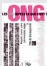
LES ONG QU'EST-CE QUE C'EST ? COTA, COULEUR LIVRES